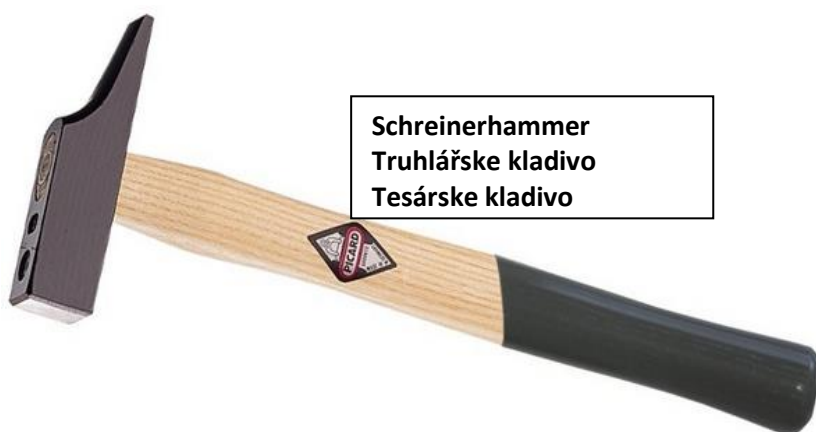
Schreinerhammer Truhlárske kladivo Tesárske kladivo