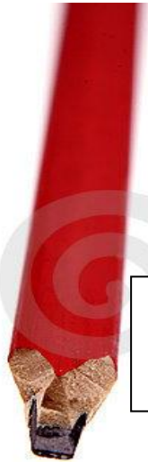
Tischlerbleistift Tesařská tužka Tesárska ceruzka