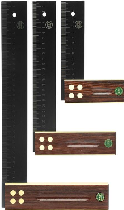
Präzisionswinkel příložník uholník