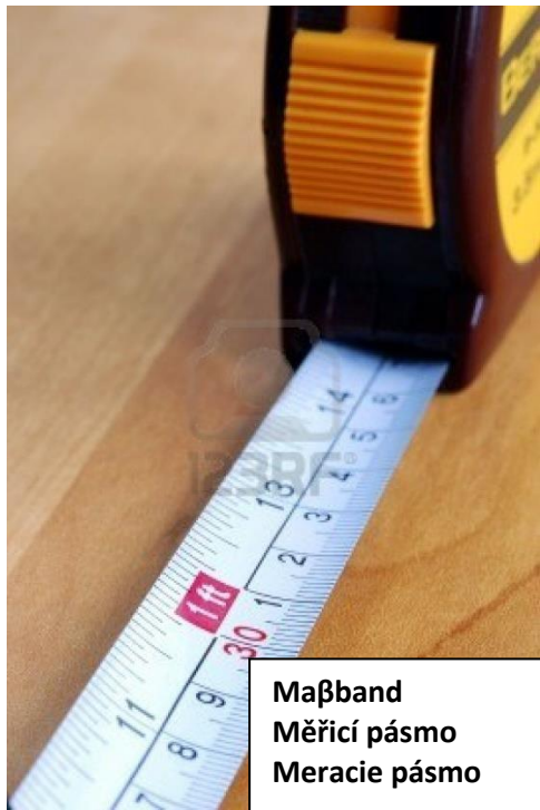
Maßband Měřicí pásno Meracie pásno