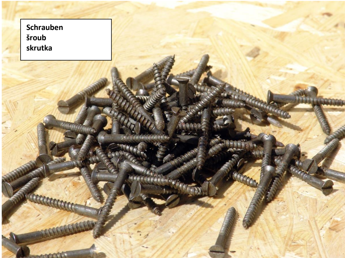
Schrauben šroub skrutka