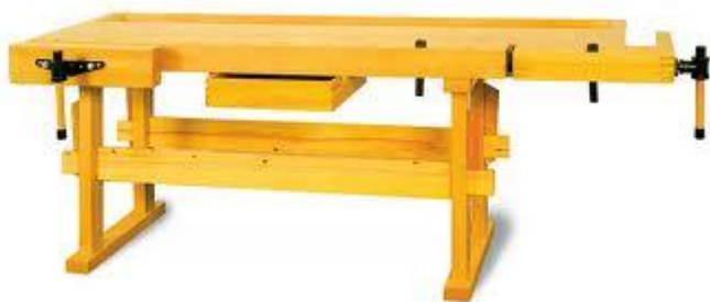
Hobelbank –hoblíce - hoblica-