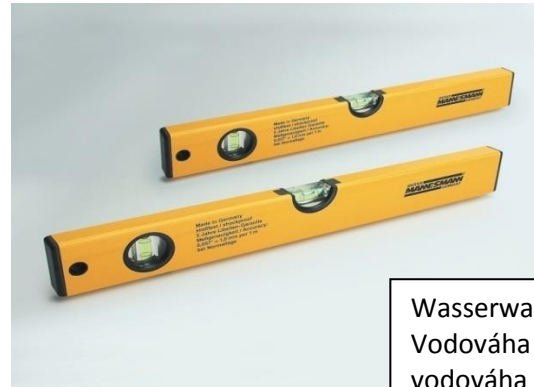
Wasserwaage Vodováha vodováha