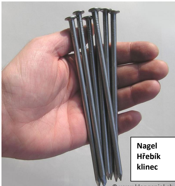
Nagel Hřebík klinec