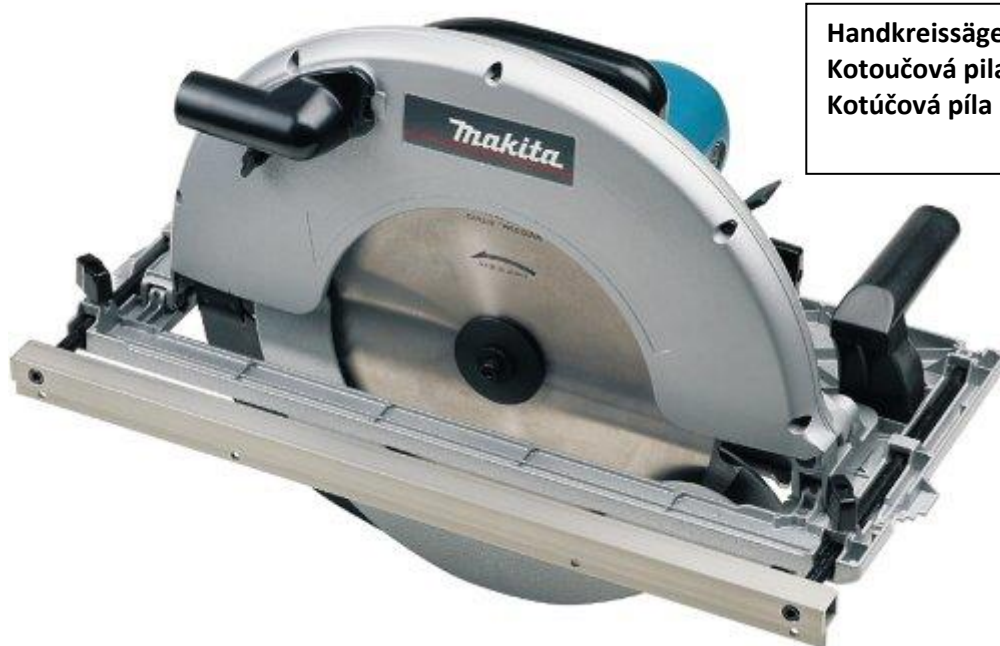
Handkreissäge Kotoučová pila Kotúčová pila