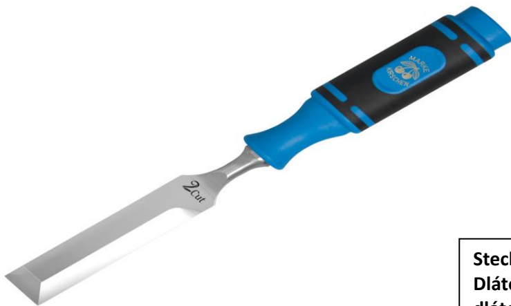
Stechbeitel Dláto dláto