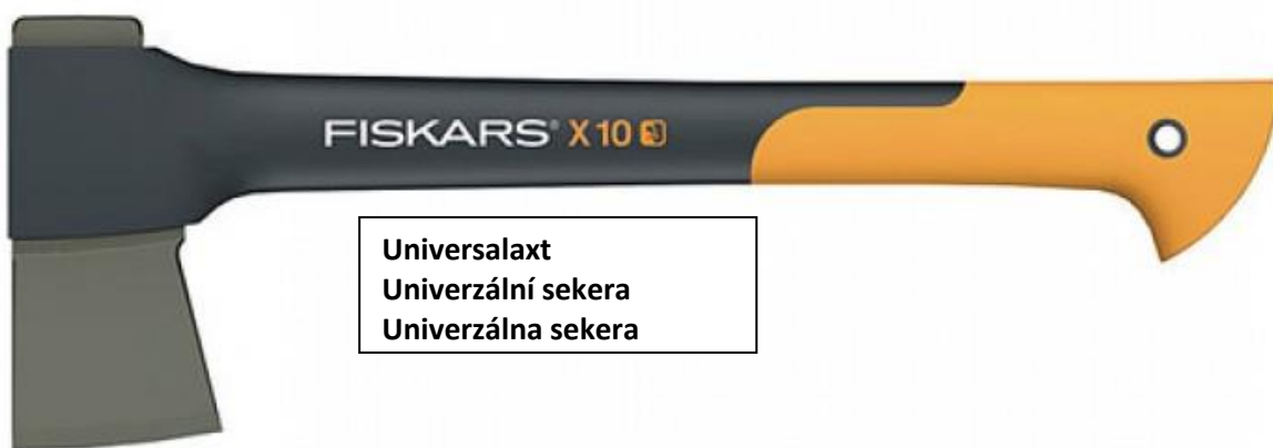
Universalaxt Univerzální sekera Univerzálna sekera