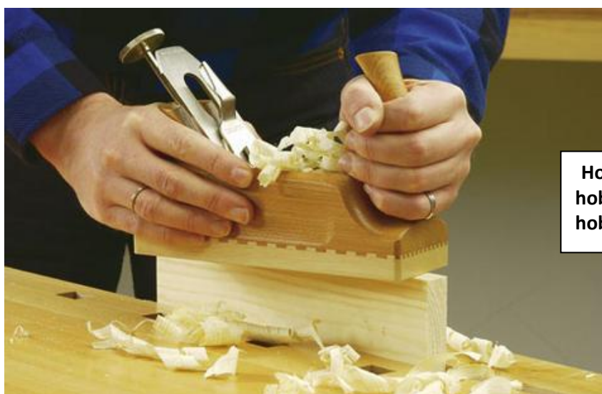
Hobel hoblík hoblík